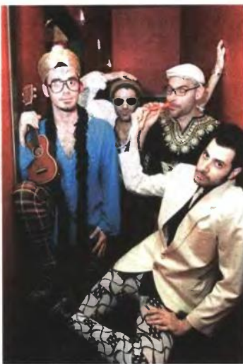
Με μπλόκη τρέλα οι Burger Project ανοίγουν στις 27 Ιουλίου το Φεστιβάλ «Αντανάκλασις» στη Μύκονο

▶ Πρόβες στο θέατρο του Πυθαγορείου στη Σύρο. Το φεστιβάλ αρχίζει στις 6 Αυγούστου